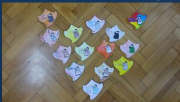
Husí stopy, které si vyrobily děti ze třetí třídy a sestavily z nich jednu velkou stopu. Mám naději, že i programy ED zanechaly letos v dětech trvalý otisk.

Za rok 2016/2017 jsem oslovila 2807 žáků ve 266 vyučovacích hodinách.