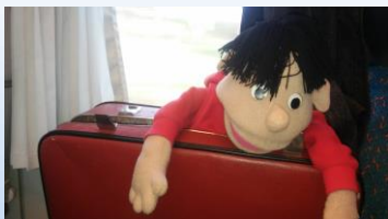
Ludvík se sbalil do kufru a jel se mnou učit o Bibli do Karviné.