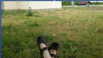
Čekání na zastávce ve Veltrubech po úplně posledním programu tohoto školního roku Docestováno. Prozatím. ☺